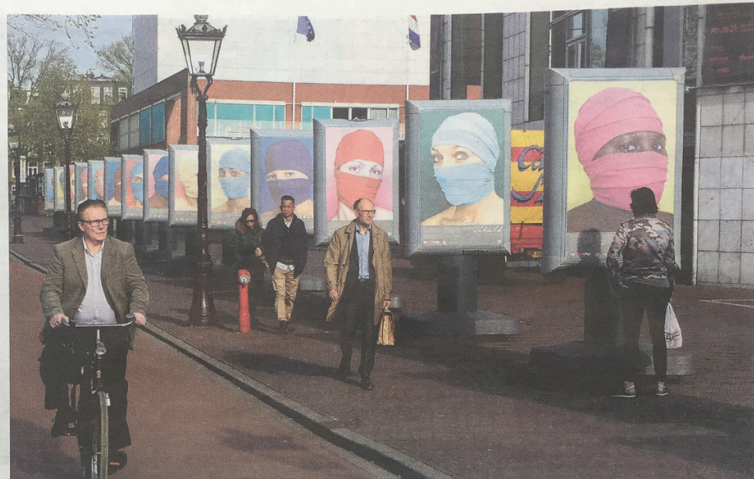
In maart stond een reizende tentoonstelling over mensenhandel bij de Stopera

Hij was illegaal in Nederland. Zijn paspoort was hem afgepakt. En één van zijn ooms dreigde hem terug te sturen als hij naar de politie zou gaan of met zijn werk zou stoppen. De jongen had geen andere keus dan doorwerken. Hij had namelijk